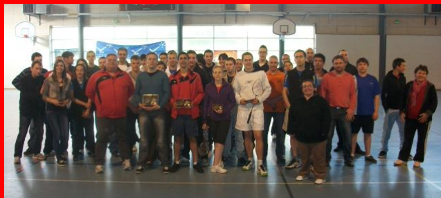
Voici des photos des participants au tournoi De badminton du 1 er Mai.