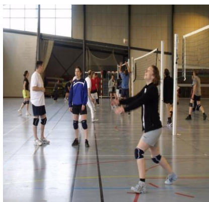
(Tournoi de volley image d'archive)