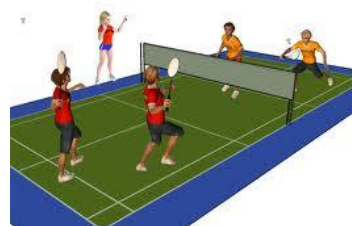
(Dessin illustrant le tournoi de badminton)